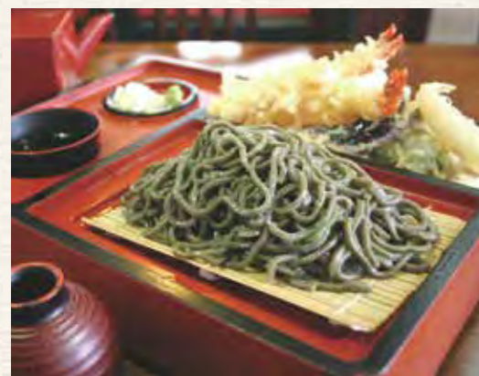
天ざるのりうどん

東松島の牡蠣は粒も大きいし味も濃いから、一度食べた人はやみつきになって何度でも来店してくれます。「よそのはもう食べられない」なんて言ってくれるので嬉しいですね。焼き牡蠣はもちろん、カキフライもおいしいですよ! 「かき小屋 海鮮堂」のみなさん