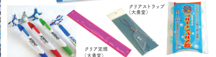
マスコット付きボールペン (あんでなしょぶ まちんど)