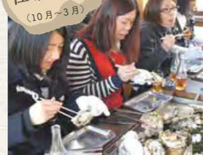
蒸し焼きで楽しめる「焼き牡蠣」