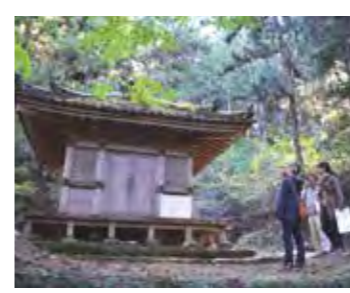
山の中で静かにたたずむ「大高森薬師堂」

初めて東松島市を訪れた人に利用して欲しいのが、観光ガイド。地元で精通した熟練のガイドが揃っている「奥松島観光ボランティアの会」では、1時間程度のコースで案内を行います(ガイド1名につき3,000円、要事前予約)。「大高森」をはじめとする観光スポットはもちろん、甚大な津波被害を引き起こした東日本大震災の