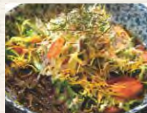
サラダのりうどん (旨い食処 あごら)

夏に食べる冷やしながら最高だし、温かいのも捨てがたい。あと、サラダ風にして出してるお店もあるから、いっそ全部食べ比べてみるのが一番! 東松島の名物料理を、ぜひ一度食べに来て!