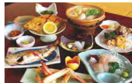
民宿自慢の料理は、海の幸が盛りだくさん