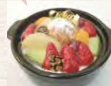
東松島鍋なべプリン