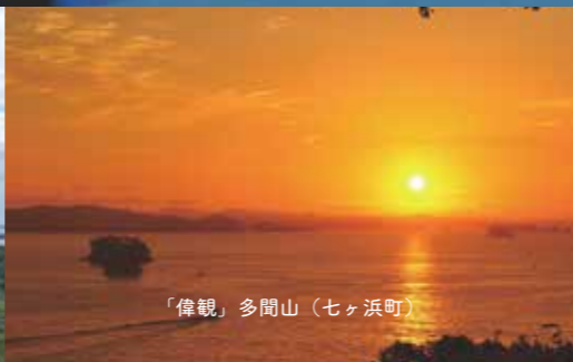
「偉観」多間山（七ヶ浜町）