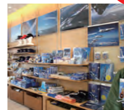
(あんでなしょぶ まちんど)

市内のおみやげ品店などでは、ブルーインパルスの関連グッズを扱っています。お気に入りのグッズをゲットして航空ファンになりませんか。