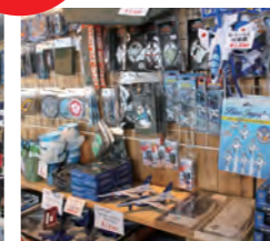
(ランウェイ ワンファイブエンド)