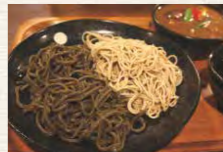
のりうどん&上下堤そばのハーフ&ハーフ (スマイルダイニング)