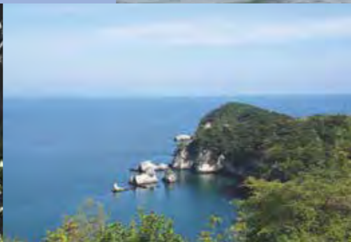
大浜唐船番所跡からの景観